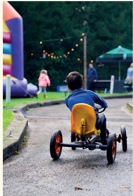
Dagje uit voor pleegkinderen georganiseerd door stichting Je mag er zijn

Een meer blijvende aandacht voor de situatie van kwetsbare kinderen is geen overbodige luxe, als we bedenken dat de invloed van de coronamaatregelen – de sluiting van de scholen, de onderbrekingen in de hulpverlening, het wegvallen van familiecontacten en structuur – op de levens van deze groep pas op de lange termijn duidelijk zal worden. Vooral netwerkpleeggezinnen hebben meer steun nodig. Stichting Kinderpostzegels overweegt een zomeractiviteitenfonds op te zetten: met een relatief laag bedrag wordt geïnvesteerd in een mooie ervaring voor kinderen, hun ontwikkeling, de relatie binnen het gezin en de relatie tussen gezin en hulpverlener. Stichting Het Vergeten Kind is bezig met het opzetten van een uitbreiding van haar 'coronaproof' hulpaanbod, gebruikmakend van haar grote groep betrokken vrijwilligers en bedrijevennetwerk, zoals bijvoorbeeld een pakket om het contact te bevorderen tussen uithuisgeplaatste kinderen en hun netwerk. Augeo Foundation is van plan om tweemaal per jaar een groep van 1000 kinderen met een jeugdbeschermingsmaatregel via het Crisisfonds-netwerk te steunen.